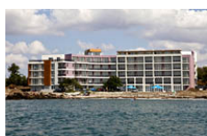
Vilmar Beach, Pomorie