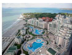
Sunset Resort phase II, Pomorie