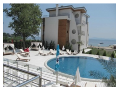
White Sails, Pomorie