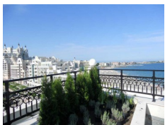
Penelope Palace, Pomorie