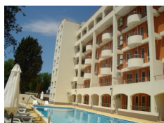
Resort Beach Pomorie, Pomorie