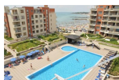
Helios Pomorie, Pomorie