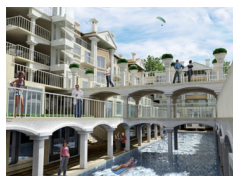
GOLF Heights, Balczik