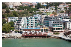
Marina City, Balczik