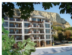
Balczik Gardens, Balczik